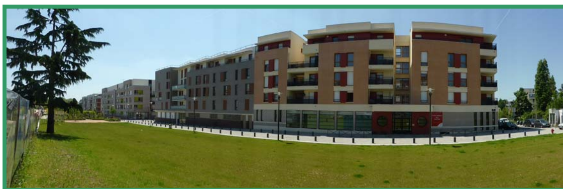
Quartier Croix Petit

La plupart des conventions arrivant à échéance à fin 2013, l'ANRU et l'agence nationale pour la cohésion sociale et l'égalité des chances (ACSE) ont prévu un dispositif de sortie de convention visant à garantir la pérennité des investissements réalisés et à consolider la dynamique de transformation urbaine. Ce dispositif s'appuie sur les plans stratégiques locaux (PSL) dont la démarche a été lancée au cours du deuxième trimestre 2012.