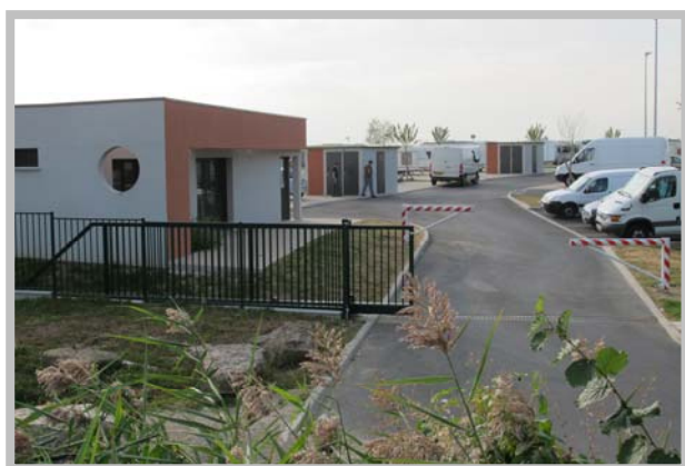
Saint-Brice sous Forêt